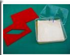
ファーマンター とセットになる販売用種菌